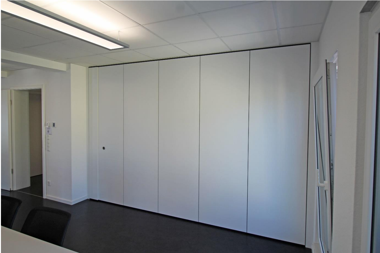
Trennwand zwischen Raum A+B geschlossen