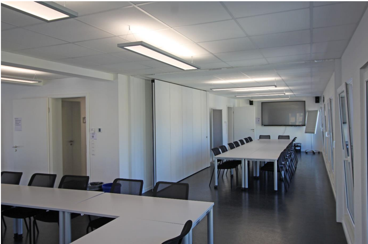
Trennwand zwischen Raum A+B geöffnet